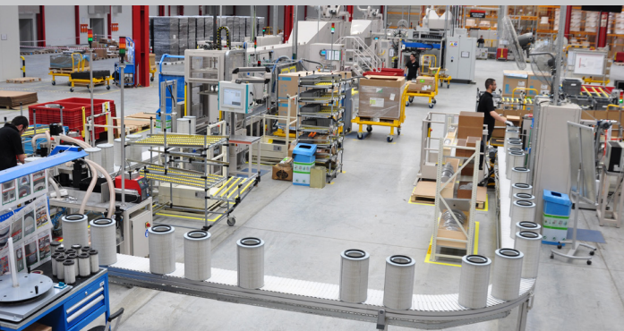
Завод Cummins Filtration в городе Измир, Турция

Мы уверены, что клиенты Cummins Filtration заслуживают продукцию и услуги самого высокого уровня. Именно поэтому мы всегда стремимся повышать уровень качества на всех этапах разработки, производства и поставки. В нашей работе мы ставим качество во главу угла. Cummins Filtration считается лидером в отрасли по качеству. Это подтверждено сертификатами.