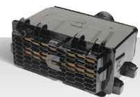
Система забор воздуха Direct Flow