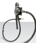
Открытая система очистки отработавших газов